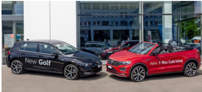
Der neue Golf und das T-Roc Cabriolet stehen zur Probefahrt bereit.

riesigen Sprung: Er ist ständig online, lässt sich neu per Gleiten, Wischen sowie per Sprachsteuerung bedienen und verfügt über die grösste Auswahl an Assistenz-systemen in seiner Klasse. Auch bei den Motoren setzt der