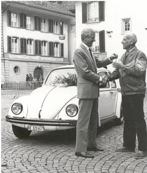
1983: Après plus de 320 000 véhicules écoulés, la dernière Coccinelle est remise à un client suisse.

Peu après la Golf, Volkswagen présente, avec la Polo, la première voiture compacte. Avec le VW LT, Volkswagen élargit sa gamme de véhicules utilitaires. Le premier chapitre de l'histoire de VW Suisse se termine le 31 mars 1983: la dernière Coccinelle est remise à son acquéreur. Après 320 637 véhicules vendus, Volkswagen met un terme à l'importation de cette voiture légendaire. La même année, la deuxième génération de la Golf poursuit sur la lancée de son prédécesseur. La suite de l'histoire de la VW Golf révèle des chiffres fort réjouissants: