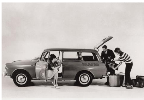
1962: la Variant, le premier break de VW.

et un moteur à l'arrière légèrement agrandi dérivé de la Coccinelle. La