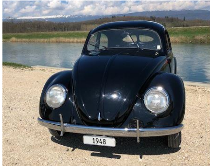
1948: la Coccinelle, le début du succès

En 1946, un an seulement après la fin de la guerre, personne ne pense que la Coccinelle puisse sortir à nouveau des chaînes de production. L'usine Volkswagen, gravement endommagée, est aux mains des forces d'occupation britanniques. À l'origine, les anglais destinaient la Coccinelle à leur propre usage, mais ont été convaincus du fort potentiel d'exportation de ce modèle. Walter