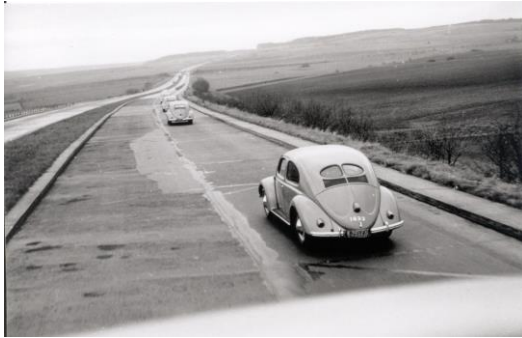
1948: les 25 premières Coccinelles se rendent en Suisse.

Il est clair qu'AMAG dispose des meilleurs atouts pour importer la Coccinelle. Toutefois, la logistique en est encore à ses balbutiements à cette époque: début mai 1948, le premier convoi constitué de 25 Coccinelles quitte l'usine de Wolfsburg et sillonne les autoroutes allemandes désertes