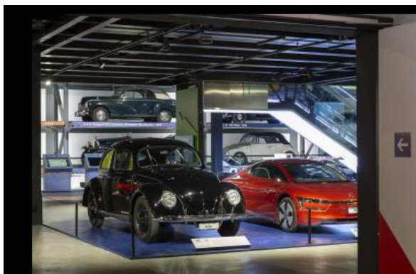
L'une des premières Coccinelle datant de 1948 à côté d'une XL1 extrêmement rare, produite à seulement 200 exemplaires.

Cham – Le 29 avril 2023 marque le 75 e anniversaire de la signature du contrat d'importation entre Volkswagen et AMAG pour la Suisse. À l'occasion de cet anniversaire, le Musée Suisse des Transports organise une exposition spéciale en collaboration avec AMAG Import SA et Volkswagen Suisse. Depuis le 1 er mai, elle est accessible à tout le monde dans la halle «Transport routier» du Musée Suisse des Transports de Lucerne, qui abrite 20 modèles d'exposition Volkswagen de 1948 à aujourd'hui. La visite de l'exposition anniversaire est incluse dans le prix d'entrée du Musée des Transports et sera possible à tout moment pendant les horaires d'ouverture habituels du musée.