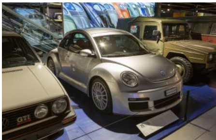
New Beetle RSi, un modèle spécial en série limitée, d'une puissance de 224 ch, au look course.

Avec cette exposition spéciale organisée à l'occasion du 75 e anniversaire des importations, le Musée Suisse des Transports de Lucerne souhaite présenter toute la gamme des modèles Volkswagen – de la Coccinelle pour tous au véhicule expérimental.