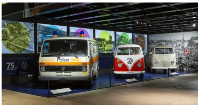
Le bus VW de première génération à plateau et le bus Samba soigneusement restauré à côté d'un véhicule d'intervention T3 de la police.

Qu'il s'agisse d'un Samba et d'un fourgon à plateau soigneusement