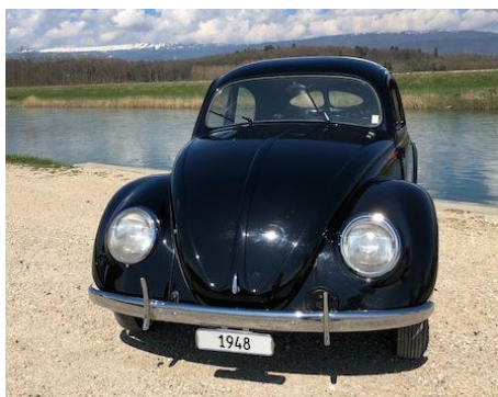
1948: il Maggiolino – l'inizio del successo.

Schznach-Bad – Il 29 aprile 2018 ricorre il settantesimo anniversario della sottoscrizione del contratto di importazione per la Svizzera tra Volkswagen e AMAG. Per anni il leggendario Maggiolino ha dominato le statistiche sulle immatricolazioni e l'immagine delle nostre città. Negli anni Settanta, la Golf ha perpetuato questo trend riscuotendo grande successo fino ai giorni nostri. Nei 70 anni trascorsi sono state immatricolate oltre 2 milioni di vetture Volkswagen in Svizzera e nel Principato del Liechtenstein. Intanto il marchio guarda anche con estrema fiducia al futuro. La nuova piattaforma interamente elettrica di Volkswagen MEB è la spina dorsale tecnologica dei veicoli elettrici Volkswagen del futuro. Consente di realizzare ottimi valori di autonomia e uno sfruttamento massimo dello spazio a costi ottimali. Entro l'anno 2025 il marchio Volkswagen pianifica l'introduzione di oltre 20 veicoli a propulsione elettrica. In futuro si svilupperà anche la trazione elettrica. Il marchio Volkswagen è pronto. La storia di successo di VW può proseguire.