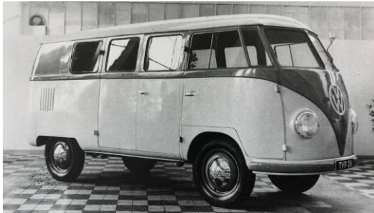
1950: il leggendario veicolo commerciale VW T1 "Bulli" giunge in Svizzera.

A partire dal 1950, al Maggiolino si è aggiunto l'oggi leggendario veicolo