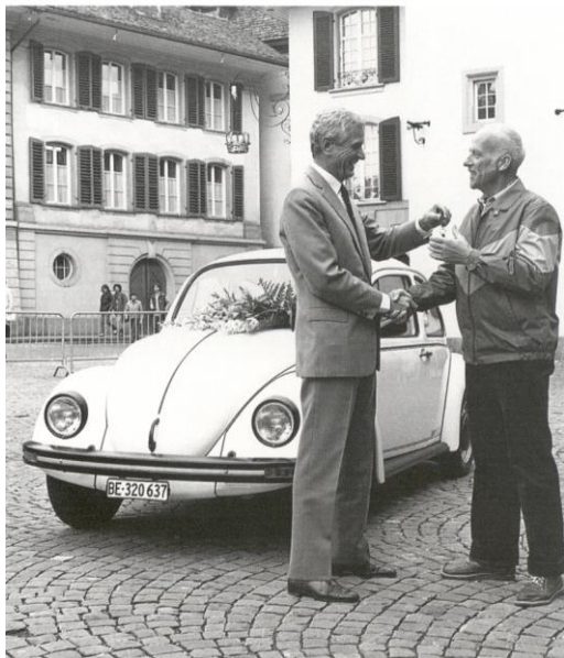
1983: dopo oltre 320'000 veicoli, viene consegnato l'ultimo Maggiolino a un cliente svizzero.

Poco dopo la Golf, Volkswagen inaugurò l'epoca delle utilitarie con la Polo. Con la VW LT anche il programma veicoli commerciali di Volkswagen venne ulteriormente potenziato. Il 31 marzo 1983 si concluse il primo fortunato capitolo della storia svizzera di VW: la consegna dell'ultimo Maggiolino a un cliente. Da quel momento in poi, dopo 320'637 vetture, fu sospesa l'importazione di quest'auto ormai entrata nella storia. Nello stesso anno la Golf di seconda generazione si riallacciò, senza soluzione di continuità, a questo successo.