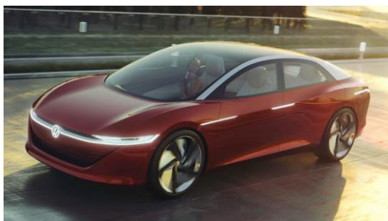
2018: il prototipo della berlina elettrica del segmento superiore I.D. Vizzion.

Temporaneamente l'apice è costituito dalla presentazione, in occasione del Salone dell'Automobile di Ginevra 2018, di un'automobile a guida completamente autonoma: la I.D. Vizzion. Sulla base di questo prototipo, il quarto modello della gamma Volkswagen I.D., Volkswagen illustra, facendo leva su tecnologie innovative, concept interamente automatico dei comandi ed eleganza formale, quale sarà in futuro l'aspetto di una berlina del segmento superiore in termini di tecnica e design.