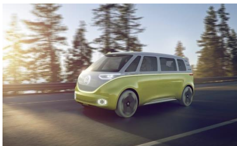
Il micro-pullmino del futuro.

Al North American International Auto Show (NAIAS) tenutosi lo scorso gennaio a Detroit, Volkswagen ha presentato lo studio di design di una monovolume chiamata «I.D. Buzz». Soltanto due mesi dopo, questa vettura con motore elettrico a zero emissioni inquinanti festeggia la première europea all'87° Salone dell'automobile di Ginevra. Dotata di trazione integrale, la nuova I.D. BUZZ dovrà essere la prima monovolume predisposta per la guida autonoma. Il pullmino del 21° secolo è costruito sulla piattaforma modulare per veicoli elettrici (MEB) del Gruppo Volkswagen e offre comfort e spazio a volontà per i viaggi. Straordinaria anche la sua autonomia massima: ben 600 chilometri. Con questo studio, Volkswagen dà un assaggio di quella che, nel mondo di domani, sarà la mobilità elettrica alla portata di tutti.