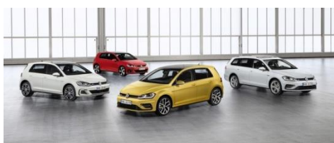
La nuova gamma Golf

R «Performance Package», Golf Variant Comfortline R-Line, Golf Alltrack ed e-Golf. Nella nuova e-Golf, i progettisti di Wolfsburg sono riusciti ad aumentare l'autonomia del 50 per cento rispetto alla e-Golf uscente; in base allo stile di guida e all'impiego, la nuova e-Golf può raggiungere un'autonomia di 300 chilometri 1 . Ma la nuova versione ha aumentato anche la potenza e l'equipaggiamento di serie. Il sistema di riscaldamento della e-Golf è un esempio lampante di come le soluzioni innovative nei veicoli elettrici possano aumentare l'efficienza, e con essa l'autonomia, con benefici quotidiani.