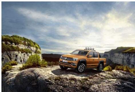
Modello speciale Amarok «Canyon»

A Ginevra la stampa scoprirà il Multivan «70 anni Bulli», modello speciale derivante dai modelli Multivan Family e Comfortline. La particolarità di questa special edition è la nuova carrozzeria metallizzata, disponibile anche nella versione bicolore con tinta «Bianco Candido» e «Giallo Curcuma Metallizzato».