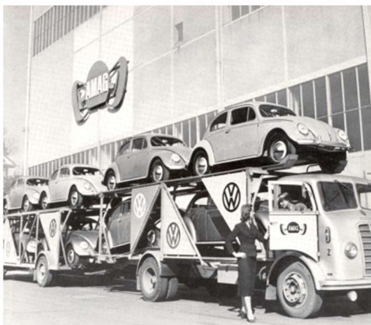
La Coccinelle marqua le début du succès de la marque Volkswagen.

Cham – Le 29 avril 2023 marque le 75 e anniversaire de la signature du contrat d'importation entre Volkswagen et AMAG pour la Suisse. Pendant des années, la légendaire Coccinelle a dominé les statistiques d'immatriculation et notre paysage routier. Au cours des 75 dernières années, plus de 2 246 006 millions de véhicules Volkswagen ont été immatriculés en Suisse et dans la Principauté de Liechtenstein. À l'occasion de cette année anniversaire, Volkswagen Suisse a élaboré différentes offres spéciales. Plus d'informations à ce sujet sur le site web de la marque Volkswagen.