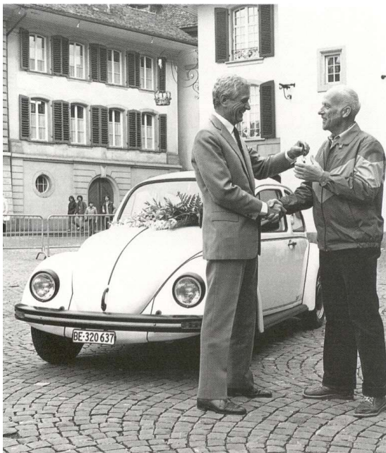
La 320 637 e Coccinelle est la dernière à avoir été remise à un client suisse en 1983.

Pendant de nombreuses années, la Coccinelle resta la voiture la plus vendue en Suisse, signant un record après l'autre. Le point culminant fut atteint en 1961, lorsque 21 111 unités furent vendues. À la fin des années 1960, Volkswagen écoulait encore plus de 19 000 Coccinelle. En mai 1969, la 250 000 e Coccinelle s'élançait sur les routes de Suisse. En 1970, ce furent encore plus de 17 000 unités qui étaient vendues. Mais ensuite, Pourtant, les ventes connaissent ensuite un déclin, les véhicules modernes