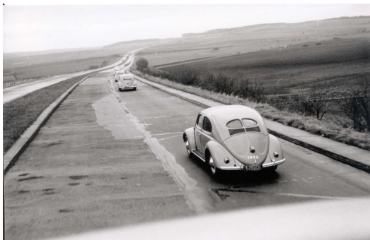
1948: les 25 premières Coccinelle se rendirent en Suisse.