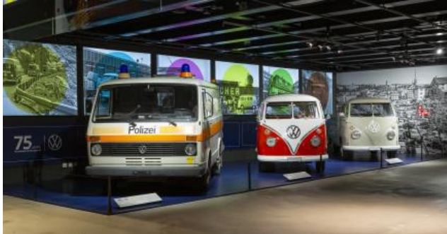
Der VW Bus der ersten Generation als Pritschenwagen und aufwendig restaurierter Samba-Bus neben einem T3 Einsatzwagen der Polizei.

Sei es als aufwendig restaurierter Samba und Pritschenwagen oder als vom