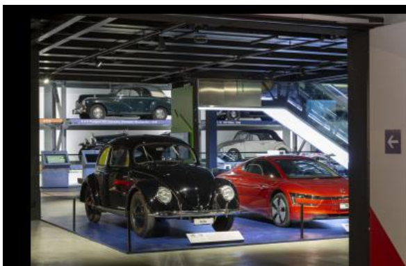
Einer der ersten Käfer aus dem Jahre 1948 neben einem äusserst seltenen XL1, von dem nur 200 Exemplare produziert wurden.

Cham – Am 29. April 2023 jährte sich die Unterzeichnung des Importvertrags zwischen Volkswagen und der AMAG für die Schweiz zum 75. Mal. Anlässlich dieses Jubiläums präsentiert das Verkehrshaus in Zusammenarbeit mit der AMAG Import AG und Volkswagen Schweiz eine Sonderausstellung. Seit dem 1. Mai ist diese in der Halle «Strassenverkehr» im Verkehrshaus Luzern mit 20 Volkswagen Exponaten von 1948 bis heute für jedermann zugänglich. Der Besuch der Jubiläumsausstellung ist im regulären Eintritt des Verkehrshauses inbegriffen und während der normalen Öffnungszeiten des Museums jederzeit möglich.