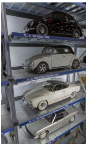
Im Schaulager sind weitere historische VW Modelle zu sehen.

Zur Jubiläumsausstellung gehört aber noch ein zweiter, nicht minder attraktiver Teil: Im Schaulager, ebenfalls in der Halle «Strassenverkehr» beheimatet, ist eine ganze Reihe des Hochregals für weitere historische